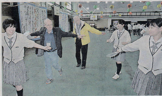
生徒と一緒に「金毘羅船々」を踊る米ハーバード大のグリーククラブOB会メンバー＝丸亀市新浜町、藤井学園

この日は同学園の中高生742人が日本と米国の国旗を振り、OB会のメンバーら39人を温かく迎えた。うちわ作りでは、メンバーが藤井高3年生37人の案内を受け、美人画や「祭」の文字などがデザインされた地紙を選び、丸亀うちわの伝統工芸士ら4人による指導で竹骨への「貼り」や形に仕上げる「たたき」などの工程に取り組んだ。