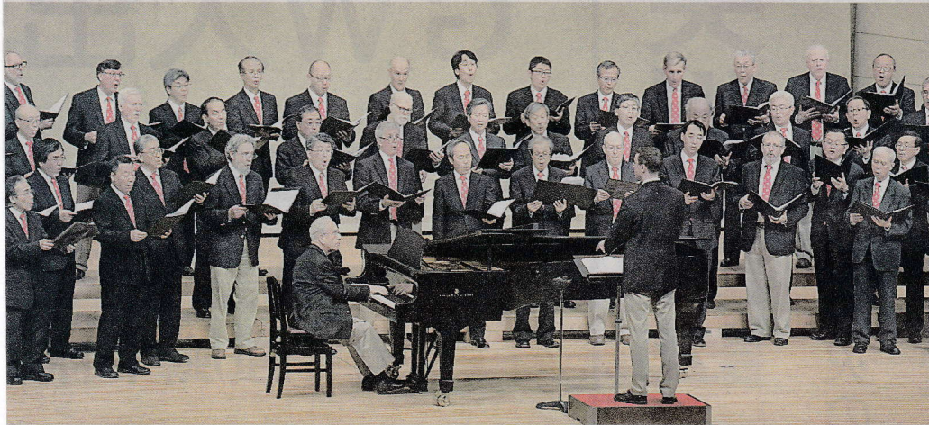
迫力ある歌声を披露した米ハーバード大、京大のグリークラブのOBによるコンサート＝高松市玉藻町、レクザムホール